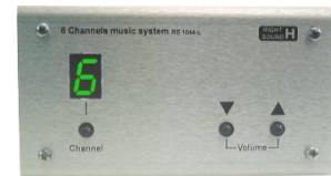
Μονάδα χωρίς ενσωματωμένο μεγάφωνο